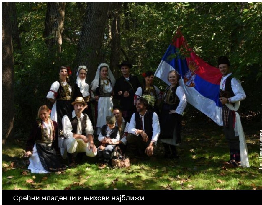
Срећни младенци и њихови најближи

Кад лишће пожути ваља се оженити, да би нам фотографија имала с ким пожутети. Тако се отприлике некада размишљало. Времена су се променила, али чувари обичаја не дају старе вредности забораву.