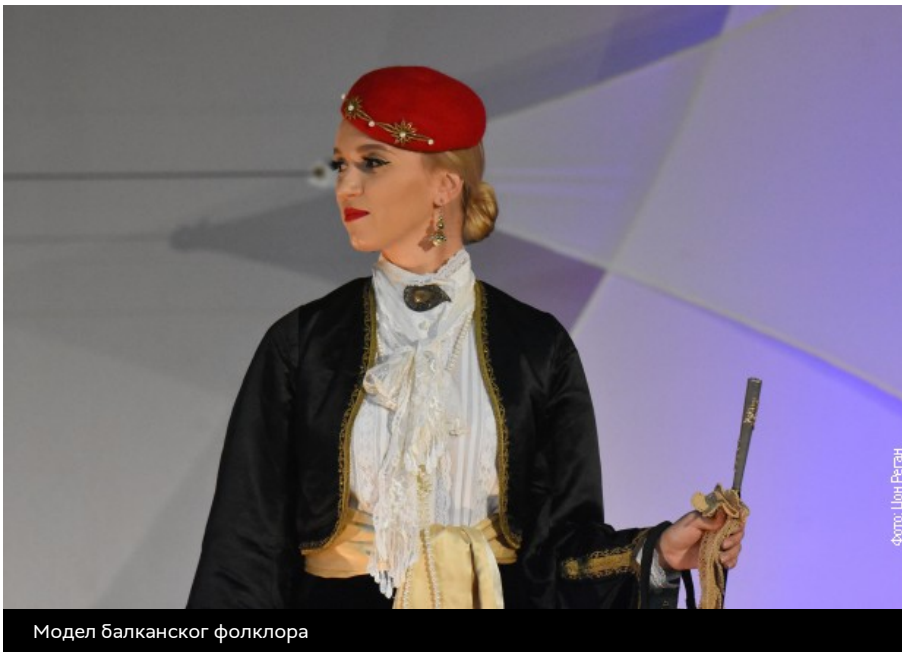
Модел балканског фолклора