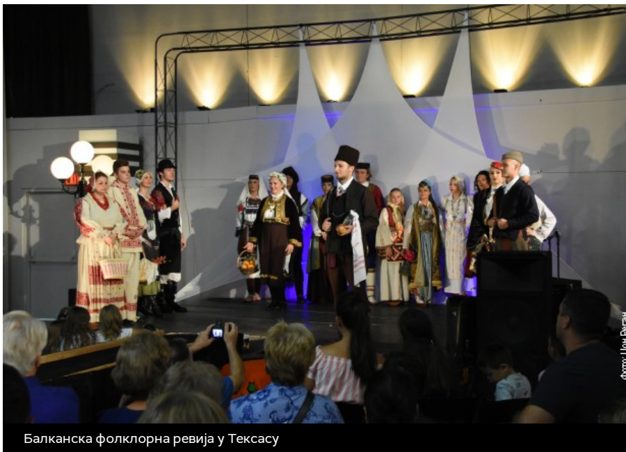
Балканска фолклорна ревија у Тексасу